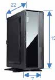
PS: 120 W Disco: 2.5" DVD: Slim