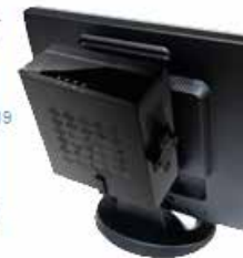
PS: 90 W DC-DC Disco: 2.5" DVD: slim