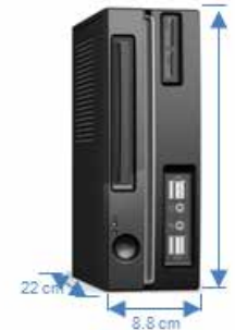
PS: 250 W Disco: 2.5" DVD: Slim PCI: Low Profile